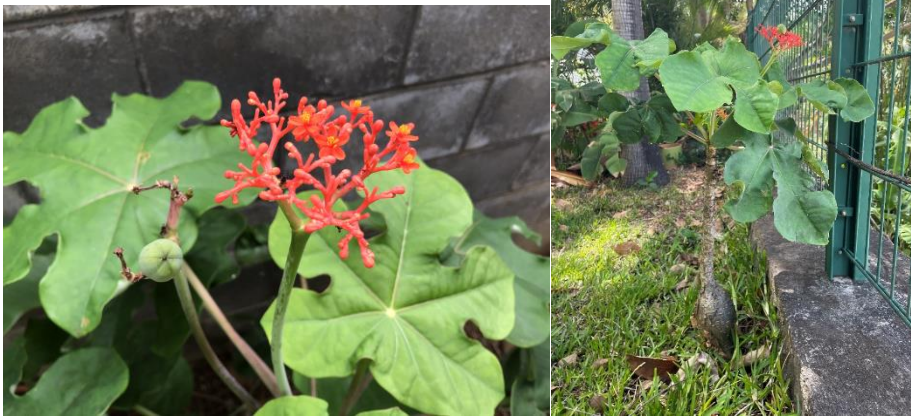
Baobab nain ( Jatropha podagrica ). Feuilles, pied, fleurs