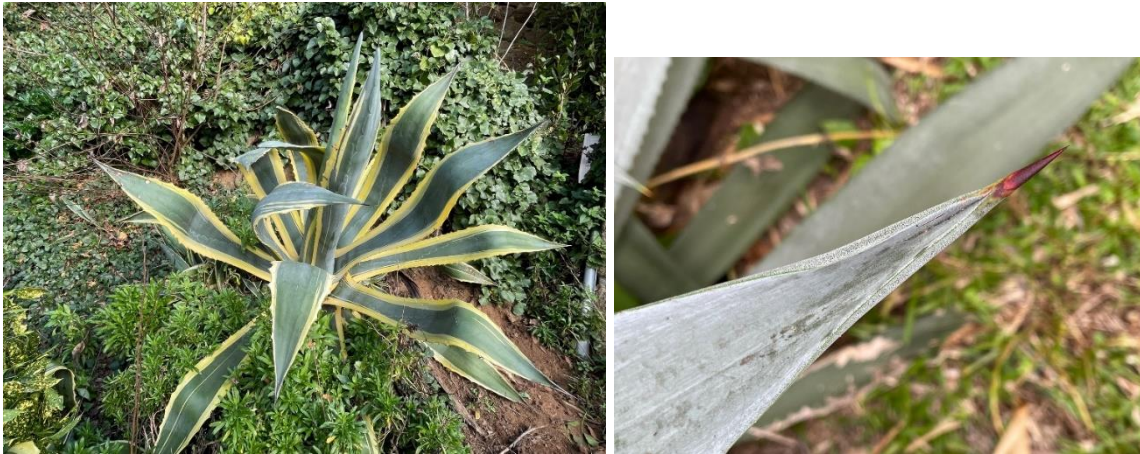
Agave d'Amérique ( Agave americana ). Feuilles, épine.