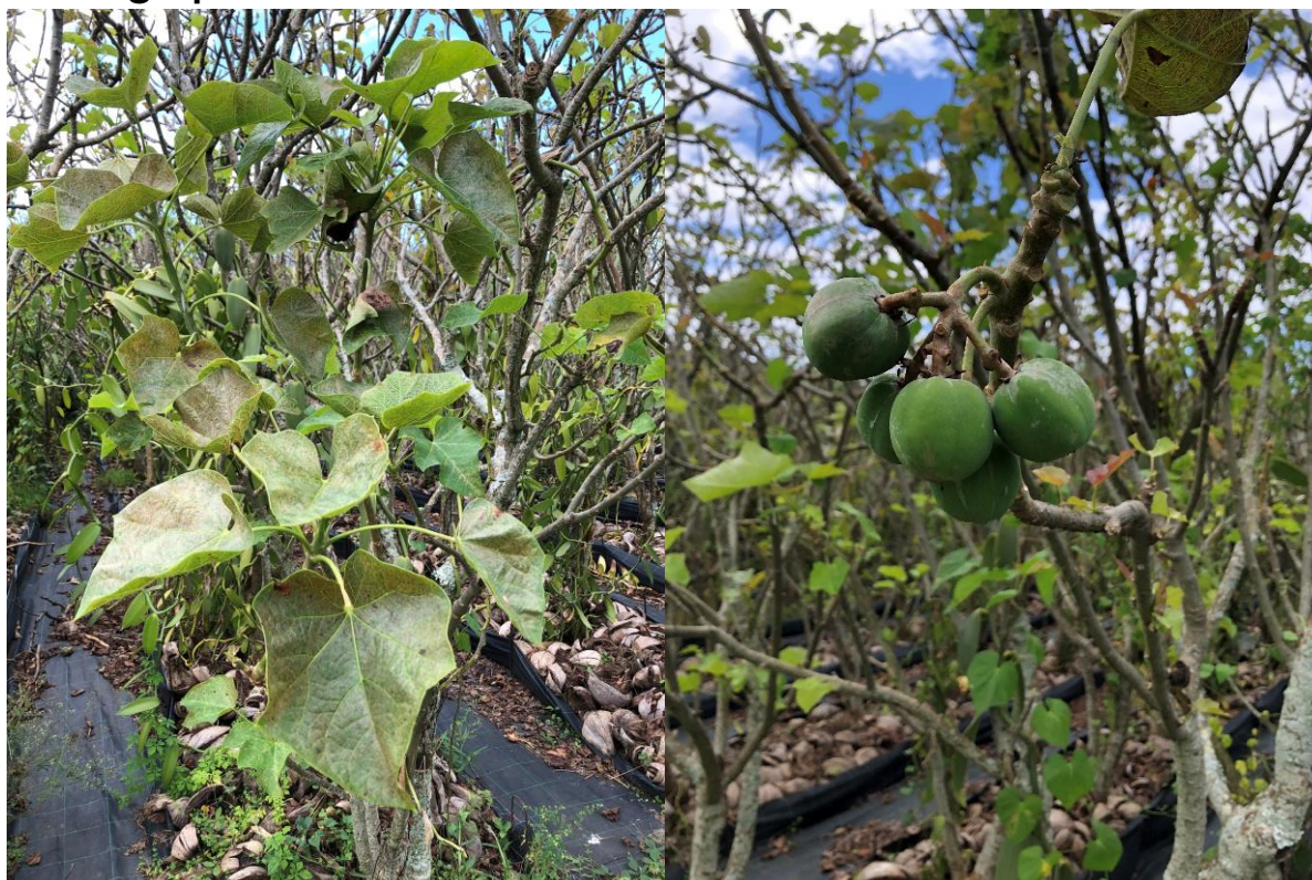
Pignon d'Inde ( Jatropha curcas ). Feuilles, capsules.