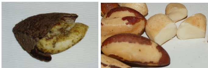
Figure 2. À gauche, noix du Brésil contaminée par A. parasiticus (Source : UMR Qualisud) ; à droite, noix du Brésil saine (source : G. Bornert).